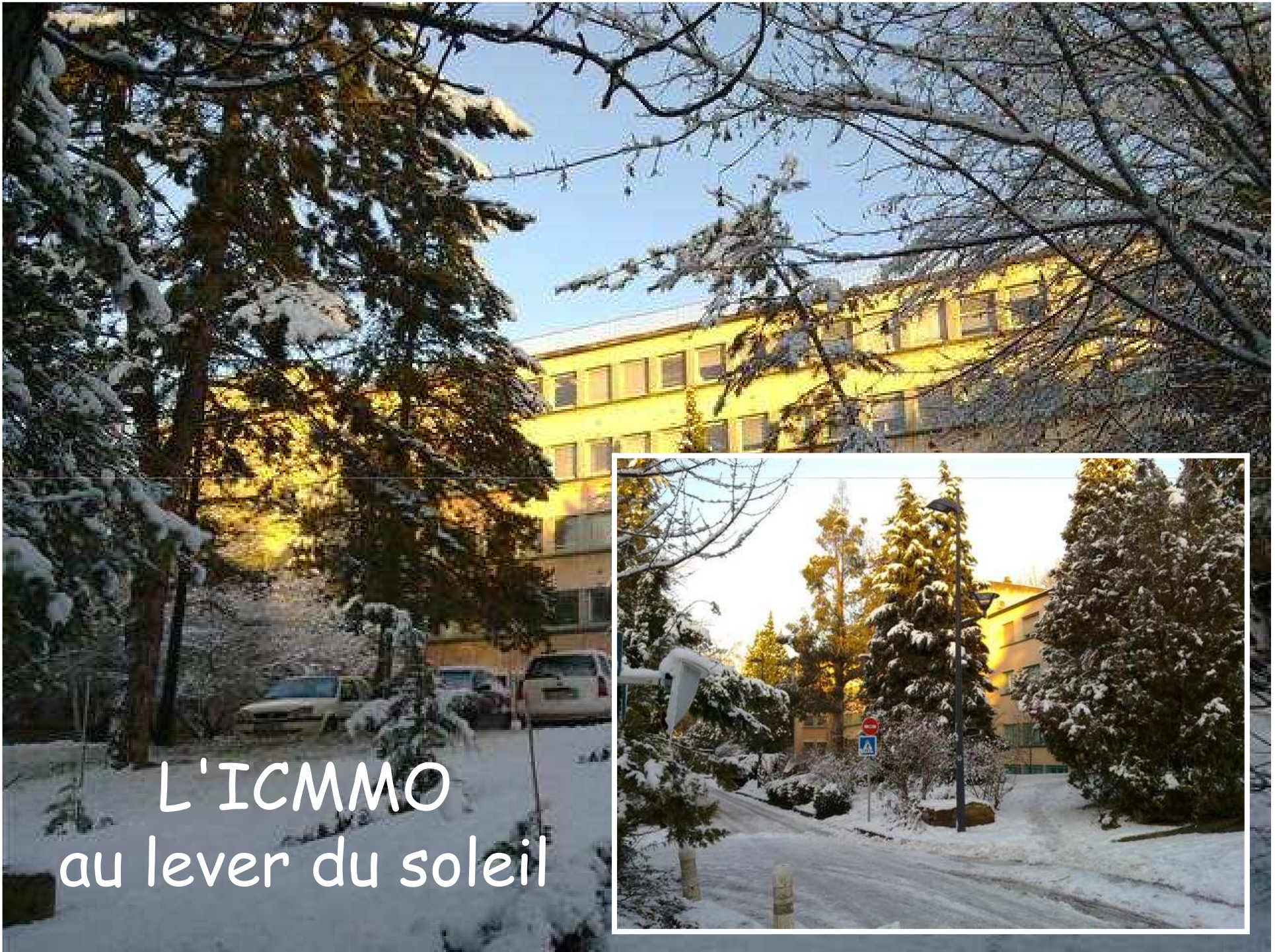
L'ICMMO au lever du soleil